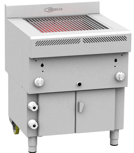
Grils avec entrée et sortie d'eau